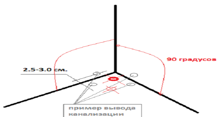
Схема вывода канализации